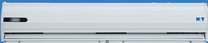
Lufttæppe model LSB120

For dørlysning: 1000 mm Max. dørhøjde: 3000 mm Spænding: 1 x 220-240V Frekvens: 50/60 Hz / opt. effekt: 350 W/h Luftmængde: 1260 – 1500 m 3 /h Mål: 1000 x 235 x 207 mm (L x H x D) Pris: kr. 4.950,00