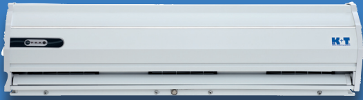
Lufttæppe model LSB90

For dørlysning: Indtil 900 mm. Max. dørhøjde: 3000 mm Spænding: 1 x 220-240V Frekvens: 50/60 Hz / opt. effekt: 300 W/h Luftmængde: 1260 – 1500 m 3 /h Mål: 900 x 235 x 207 mm (L x H x D) Pris: kr. 4.750,00